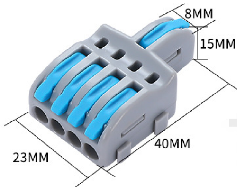
一进四出蓝色接线端子