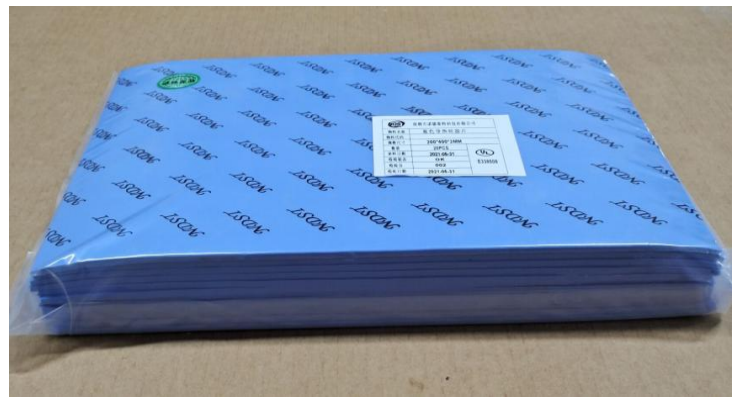
把产品装入 PE 胶袋，并贴上内标签