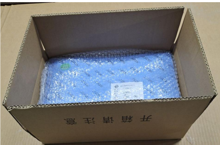
装贴好内标签的产品装入纸箱，每箱 30PCS