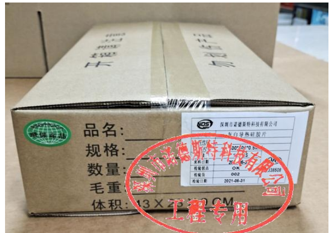
装箱，并贴上外标签及 ROHS 标签后封箱