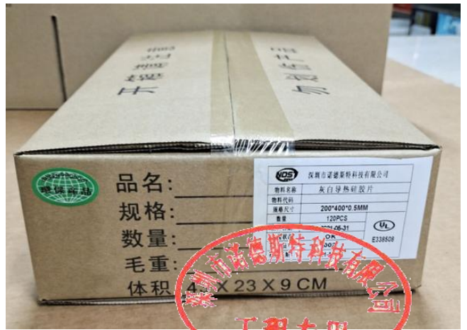
装箱, 并贴上外标签及 ROHS 标签后封箱