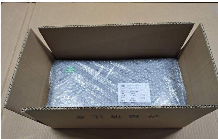
装贴好内标签的产品装入纸箱, 每箱 24PCS