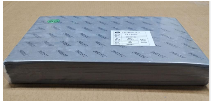
把产品装入 PE 胶袋, 并贴上内标签